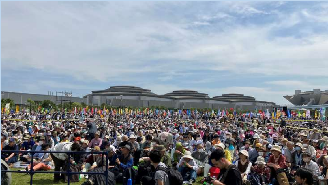
📷2026.5.3 憲法大集会 東京都江東区東京臨海広域防災公園

現役時代の卒業式では、「国民主権・基本的人権の尊重・戦争放棄」の憲法3原則を呼び掛けの中にも必ず入れていたことを思い出す。来賓の自民党市議会議員からも「平和憲法は大事だ」と言葉をいただいたこともある。「戦争は御免だ」という思いは、保守層の方も含めて戦争体験のある人々の共通の思いでもあった。5月2日土曜夕のTBS「報道特集」では、元自民党幹事長・古賀誠氏がそのことを語っていた。