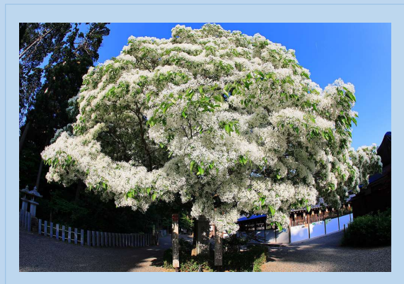
📷なんじゃもんじゃの木(深大寺境内にもある)